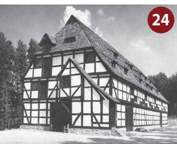
oben: Altes Pfarrhaus unten links: Gebäude der Staatsdomäne unten rechts: Eckturm der Trendelburg