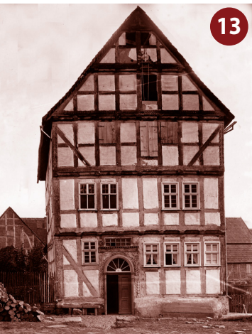
oben: Schlosserei Lieber