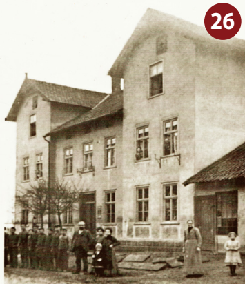
oben: Die Trendelburg, um 1900